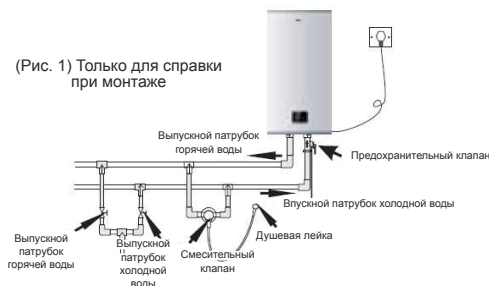
(Рис. 1) Только для справки при монтаже