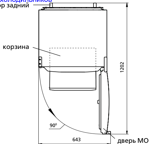
Рисунок 2 – Холодильник (вид сверху)