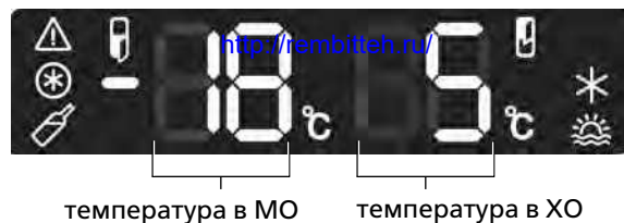
температура в МО